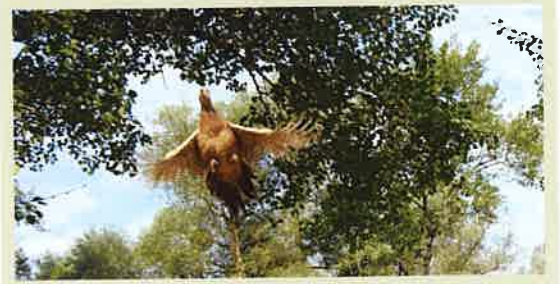
Photo prise par Jules, 10 ans, « au marais » lors d'une journée de corvée de chasse

Le deux juillet, l'association des boulistes de Presilly organisait une belle manifestation à Dompierre. Le soleil jouait à cache-cache avec les nuages mais les adeptes du « petanco* » furent comme à l'ordinaire adroits, précis, enthousiastes et conviviaux. Merci à eux de choisir notre commune pour des duels somme-toute bon-enfant, avé l'accent.