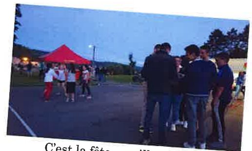
C'est la fête au village!