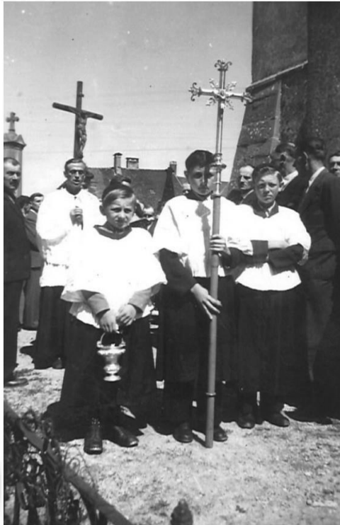
Les obsèques le jeudi 13 juillet 1944

Le jeudi 13 juillet 1944, à 10h30, ont lieu les obsèques des pauvres victimes.