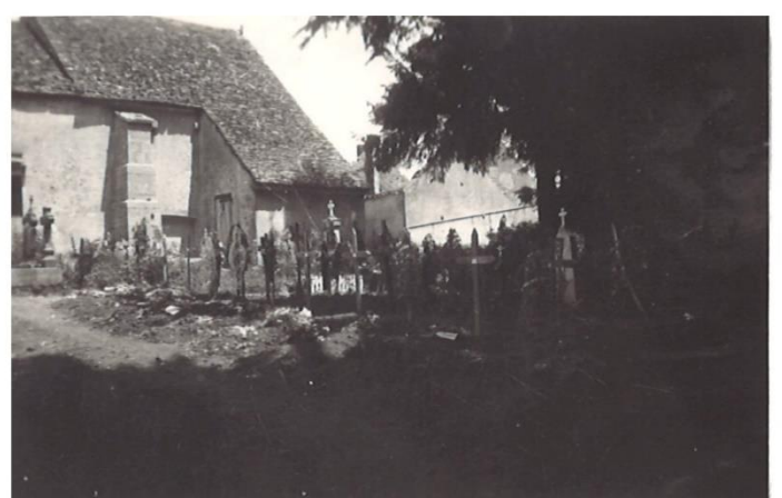
Les tombes fleuries