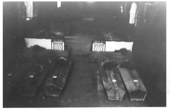
Les cercueils alignés dans l'église

Dès la fin de la fusillade, Une chapelle ardente est installée dans la salle de classe. Des équipes de secours arrivent des communes voisines : Alieze, Marnezia, Presilly, Merona. Les volontaires s'affairent auprès des blessés, puis certains iront à la scierie pour fabriquer les cercueils. Les autres creusent les tombes :