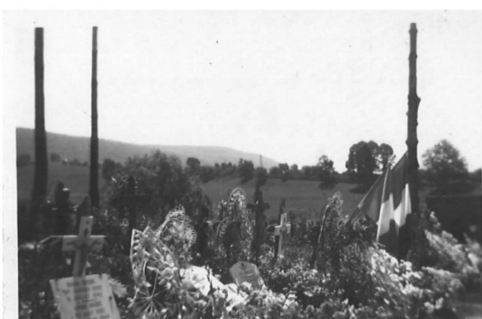
Au cimetière, l'allée des fusillés